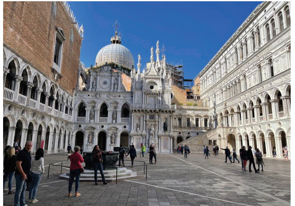
总督府 (Palazzo Ducale)