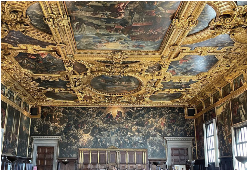
总督府内的国会厅