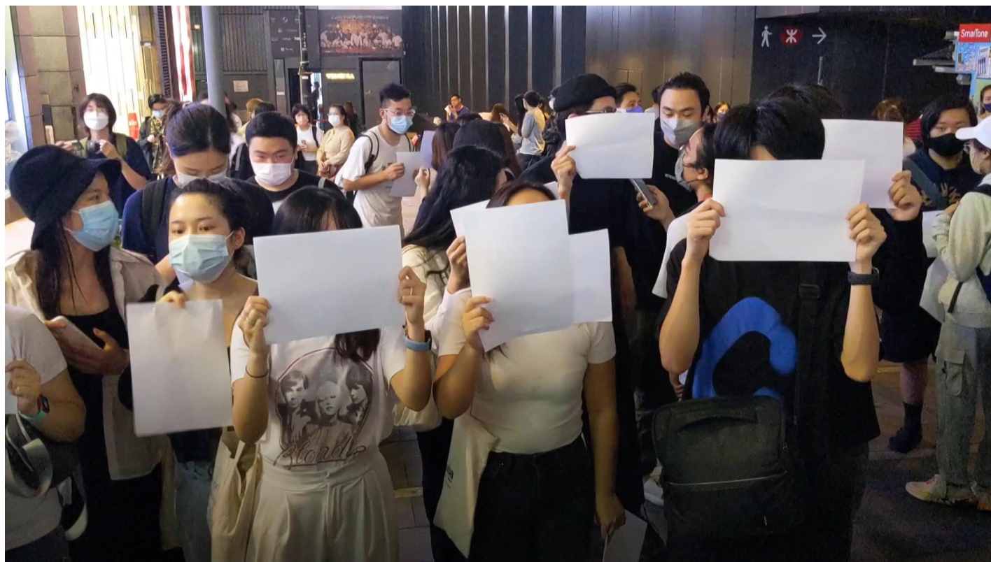
中国各地爆发白纸运动

11月24日乌市吉祥苑小区一栋高层住宅楼发生火灾。消防人员进行了长达3个小时的救援工作，大火造成10人死亡和9人受伤。民众质疑官方隐瞒伤亡人数，并认为事件造成如此严重后果的原因是严厉的封控措施使受困群众不能逃生，且救火车受阻没有及时到达。