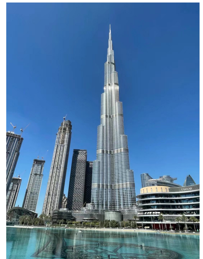
市中心的哈利法塔 (burj khalifah)