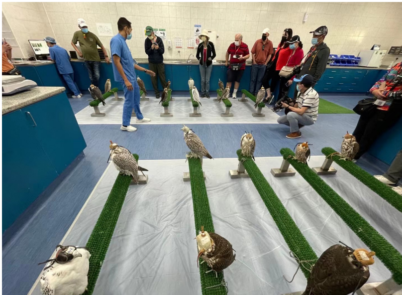
阿布扎比的猎鹰医院