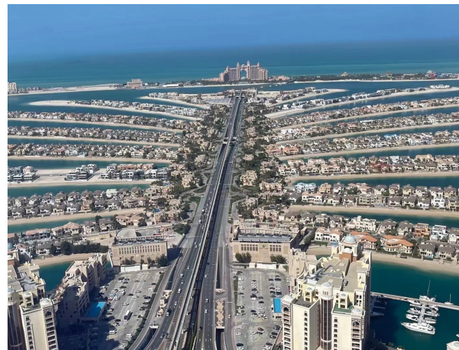
←迪拜香料和黄金市场 迪拜棕榈岛↑帆船酒店外景↓