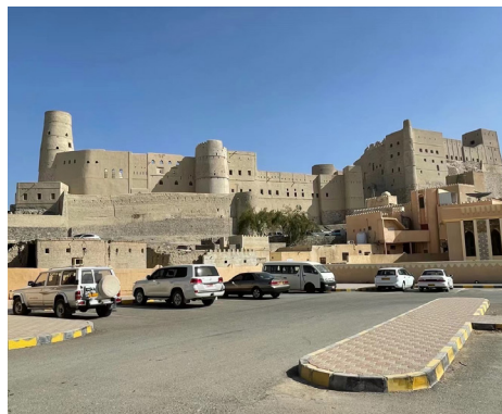
巴赫拉城堡 (Bahla Fort)

窗外，美轮美奂的人造棕榈岛，虚无缥缈的阿拉伯海湾，一望无际的红色沙漠，以及规划整齐的棕榈树使迪拜显得更加虚无缥缈。