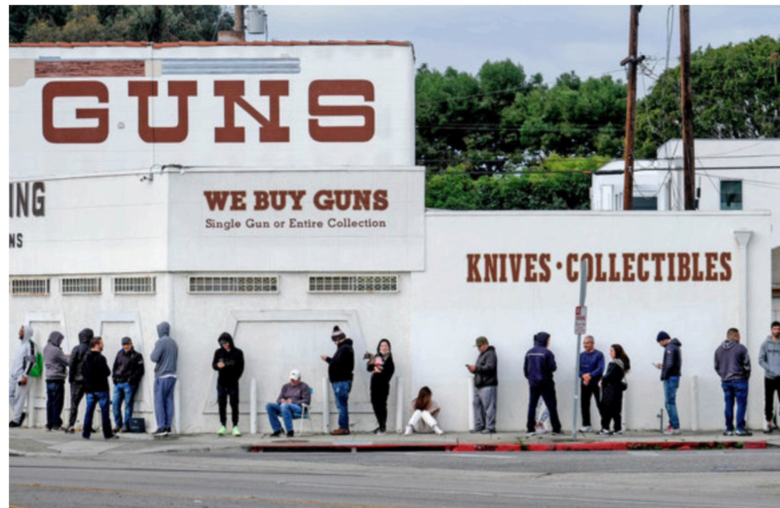
▲ 2020年，在新冠病毒肆虐下，人们在加州卡尔弗城的一家枪支店外排队等候。