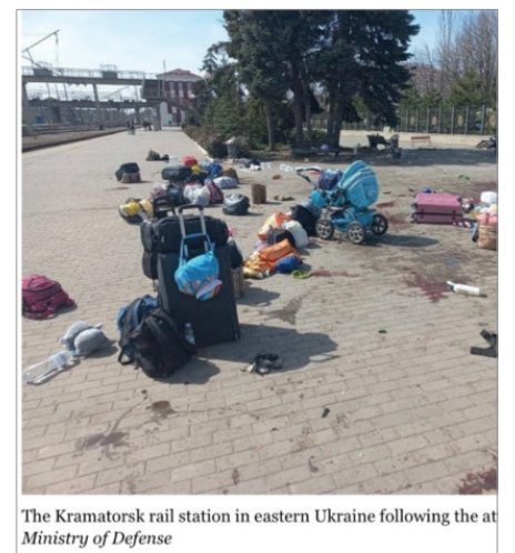
The Kramatorsk rail station in eastern Ukraine following the attack by the Ministry of Defense

随着俄军在顿巴斯地区新一轮攻势的逼近，乌克兰正在“做最坏的准备”，包括敦促该地区的民众尽快撤离。Kramatorsk火车站是该地区唯一的交通枢纽。8日，该火车站被俄军的短程导弹击中。据乌克兰官方消息，当时逾4000人在火车站集结，至少50人被炸死，其中有5个儿童，近100人被炸伤。俄军承认攻击乌克兰火车站，但否认承担责任。在一枚未爆炸的弹壳上，用俄语写着：“为了我们的孩子”。