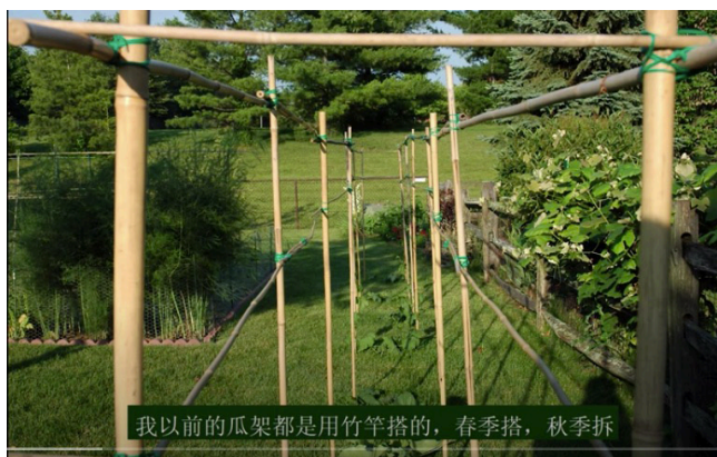
我以前的瓜架都是用竹竿搭的，春季搭，秋季拆

敲铁桩子可以专门的工具，叫做post driver或者post pounder，但就几个铁桩子，就没有必要买一个post driver了，用榔头就行。在敲桩子的时候，垫一根树木，就不会把铁桩子敲出锋利的尖口。铁丝，用来将铁丝网围栏绑在铁桩子上。老虎钳当然也是少不了的。