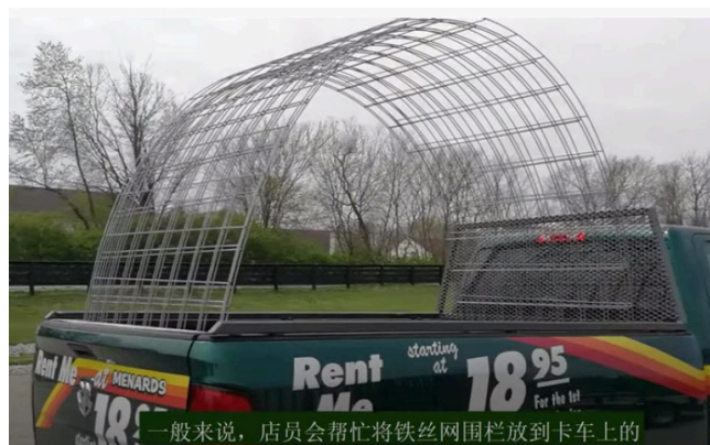
一般来说，店员会帮忙将铁丝网围栏放到卡车上的