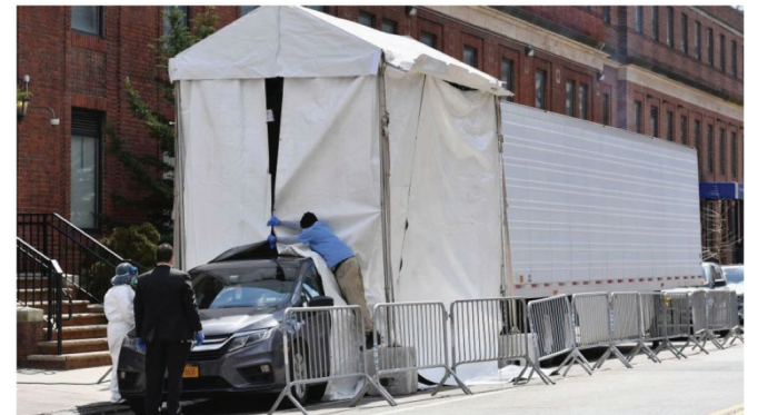
A hearse car backs into a refrigerated truck to pick up deceased bodies outside of the Brooklyn Hospital on April 1, 2020 in New York City.

11月16日上午，印州Vigo郡卫健委负责人Joni Wise称，该郡殡仪馆已经承受不了尸体的增加，郡政府租用了4辆冷冻卡车存放尸体。卫健委主任 Brendan Kearns称，新冠病毒的主要传播途径是酒吧、餐馆和类似的私人聚会。一些人不戴口罩。现在医院已经满了，医护人员的压力太大了。她们恳求居民戴口罩、保持社交距离，保护自己 and 周围的人。