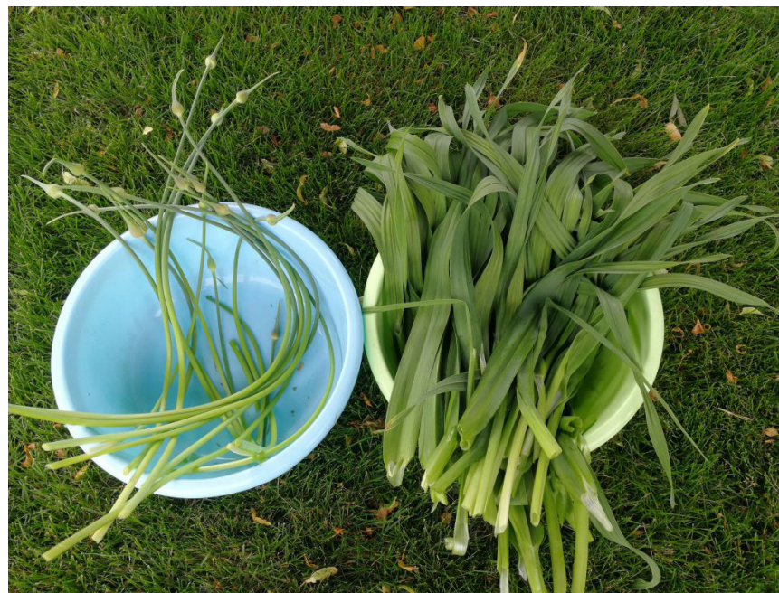
蒜苔和蒜叶分开，蒜苔炒腊肉，蒜叶炒肉片

大象大蒜因为夏天和秋天都在地下，所以不和其他蔬菜抢地方。因此，大象大蒜可以种在菜地的边边角角（如紧贴篱笆的地方）。这样种大象大蒜，既能收获肥嫩的蒜苔，又不影响其他蔬菜的生长，大大地提高了庭院小菜地的利用效率。