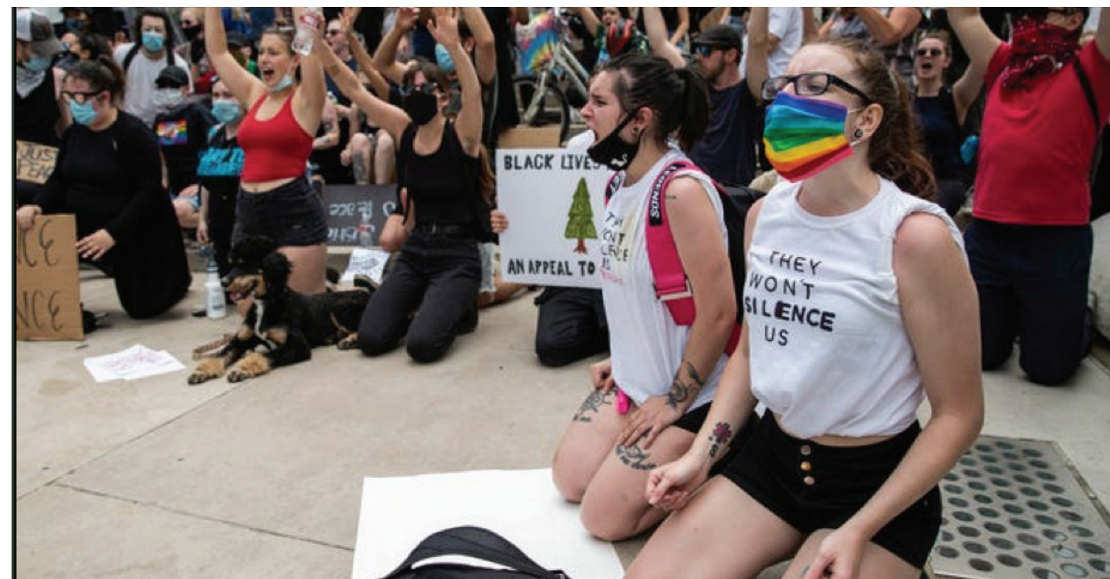
▲上周末，在印城市中心和平示威的群众

为什么一些人顽固坚持白人至上的种族主义呢？这还得从根儿上说起。现代化最早是从欧洲兴起的。从十六世纪起，欧洲国家依