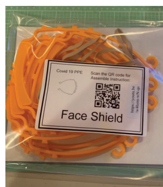
▲ 面罩包装袋，里面有待组装的架子和面罩膜