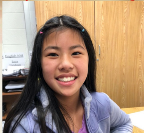
By Clara Rossow

中国的新年，很多人回家旅行探望家人。大家放焰火，穿红色的新衣服以求幸运。大家一起吃年夜饭，吃饺子。老人给孩子红包。孩子们祝福长辈！