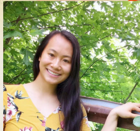
By Elli S

中国的新年，很多人回家旅行探望家人。大家放焰火，穿红色的新衣服以求幸运。大家一起吃年夜饭，吃饺子。老人给孩子红包。孩子们祝福长辈！