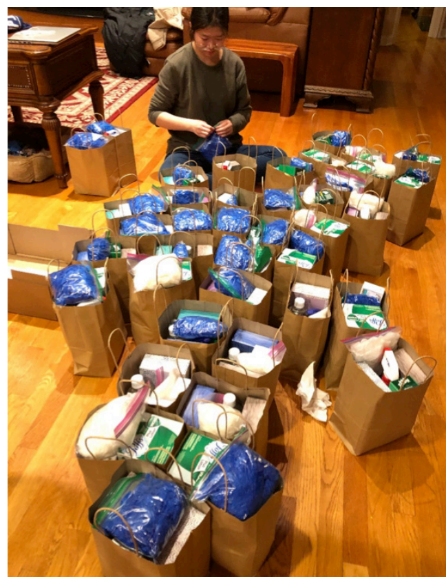
▲3月16日捐给40位IPS学生及其家庭的个人家庭卫生防护包。

• 直接捐赠卫生防护用品，联系我们： childrenseyeontheGlobe@gmail.com 电话：317-332-5214（回玉华）