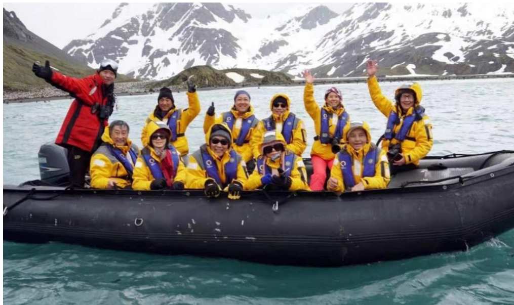
▲ 驴友们在冲锋艇上的煞爽英姿

最后一天晚上，船长举办告别鸡尾酒会和晚宴，把这次探险之旅的欢乐气氛推向高潮。新老朋友，举杯同庆南极探险之旅圆满成功！