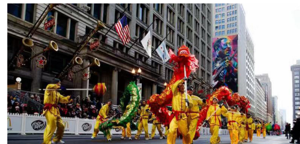
ICCCI舞龙队受邀在芝加哥盛大游行