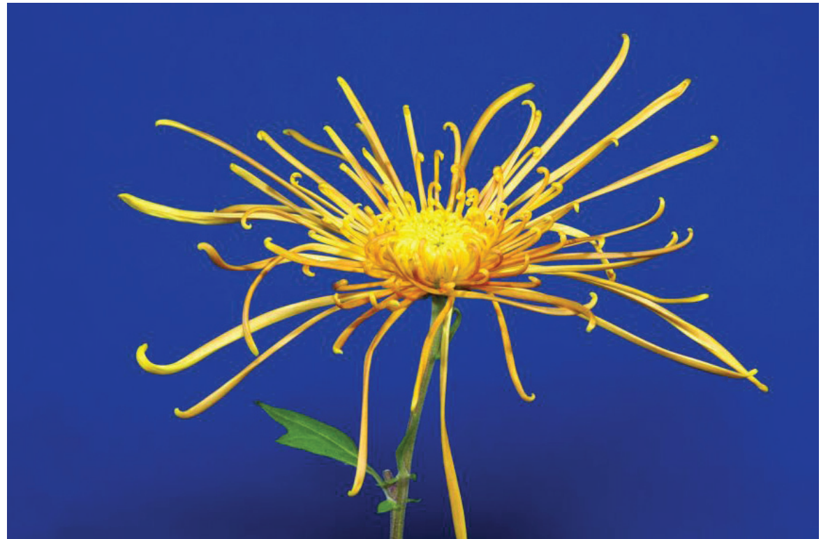
上图：金丝雀般的中国菊