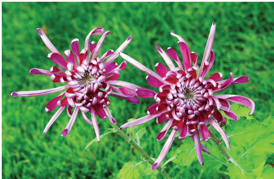
含苞待放中国菊，好似十八小娇娘