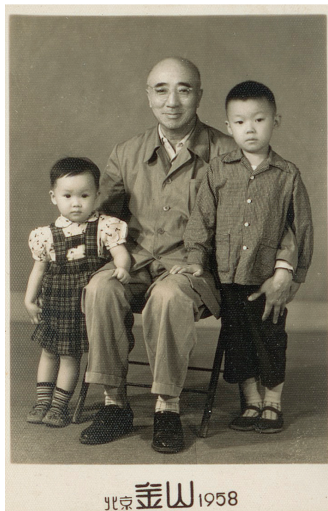
▲1958年9月，离京前李宗恩和孙子、孙女拍了唯一一张照片

编者按： 当今，中国14亿人口的人均寿命已达74岁，最新的医疗技术在城乡广泛应用。但一百年前，中国4亿人口的人均寿命仅35岁，各种疾病流行，中国人的体质虚弱到被称作“东亚病夫”。这一翻天覆地的变化应归功于中国的早期医学教育家。他们在20世纪初把西方医学带回中国，研究危害中国人民健康的各种疾病，培养第一代本土医生和学者。最难得的是，他们在抗战之初，放弃舒适的生活和工作环境，到艰苦的大后方继续治病救人、教书育人，使无数流亡学生得以完成学业，为抗战建国贡献自己的力量。李宗恩医生——国立贵阳医学院创始人、协和医学院第一任中国籍院长，就是其中的一位医学教育家。今年是李宗恩医生125周年诞辰，其孙女李维华历时十年创作和编辑的李宗恩纪念文集《民国医学教育家李宗恩》《李宗恩先生编年事辑》《李宗恩医生文存》终于完成。该套文集即将被国会图书馆和14所高等学府的东亚图书馆收藏。抚今思昔，敬往思来。让我们从这些文字和档案中了解那段珍贵的历史。