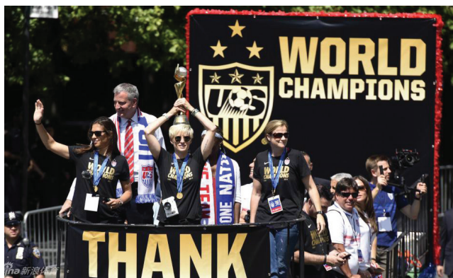
纽约庆祝女足夺冠大游行

7月6日，美国女足在法国里昂以几乎压倒性的优势2:0战胜荷兰队，第四次荣获世界女子足球冠军。在场观众的庆祝欢呼声中，世界足联主席Gianni Infantino入场祝贺，此时观众席里发出了另一个越来越响亮、此起彼伏的呼声——“Equal Pay”。就在前一天，Infantino宣布将加倍女足冠军的奖金，从3千万到6千万，这一听上去很高的数字，比起男足冠军的4亿4千万奖金，只是小巫见大巫了。