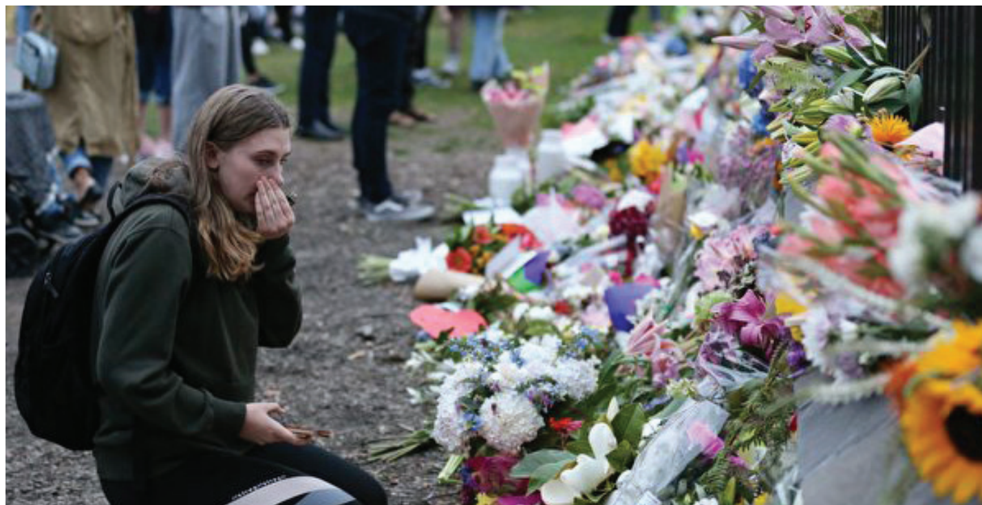
人们在事故地点纪念在3月15日的恐袭中逝去的生命。（网络图）

【本报综合】素以族群和谐、社会安宁著称的位于地球边缘的太平洋岛国新西兰，3月15日以一种惨烈的方式成为国际舆论的焦点：克赖斯特彻奇市的两座清真寺发生了新西兰建国以来规模最大的恐怖袭击，50人遇难，另有50人受伤。