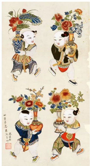
▲四季平安，天津杨柳青木版年画，清康熙，中国美术馆藏

纸马表现的内容最初以自然神居多，后因儒、释、道宗教影响而产生众多如地藏王菩萨等神位；随着手工业不断发展，人们举出造酒业杜康等行业祖师化神；市民阶层兴起后，又出现了大量如五路财神等出于求财祈福现实需要的纸马画像。它们形制不一、功用有别，囊括了自然之精、佛祖道仙、儒圣家先、行业祖师和英雄人杰等，可谓森罗万象。