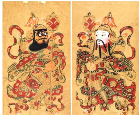
▲神荼郁垒门神，天津杨柳青木版年画，套板彩绘，清代，李文墨藏

戏曲类年画非常适合年节的娱乐性需要，往往选择场面热闹、情节闹猛的经典剧目，以期亲朋好友，围坐叙谈，“百看不厌、百听不厌”，有今日海报之风。有张《穆桂英大破天门阵》，内容源自《杨家将演义》，故事本身已经颇为曲折复杂：杨六郎