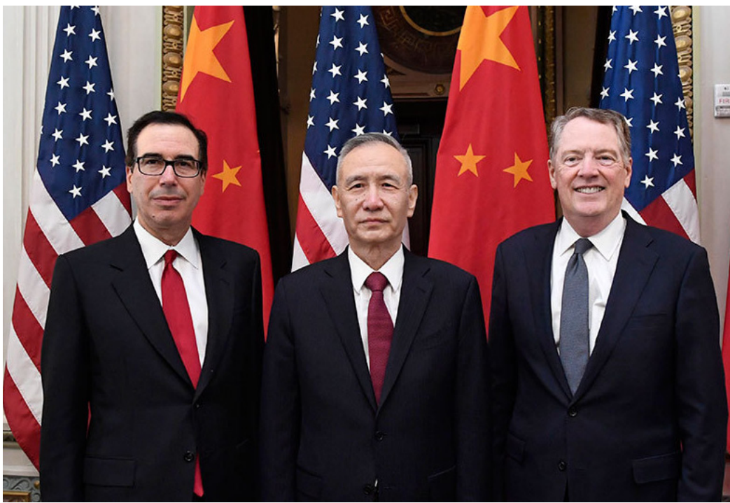
2月21日上午，刘鹤与美国贸易代表莱特希泽（右）、财政部长姆努钦（左），在美国白宫艾森豪威尔行政办公楼共同主持第七轮中美经贸高级别磋商开幕式。

易战谈判为目的的第四次美国之行，他还再一次被赋予“习近平特使”的头衔。加了这一“特使”职衔等同于增加了刘鹤的授权，在一些重要问题上，他代表的将不仅是中国政府，也代表中国党政军最高领导人习近平。