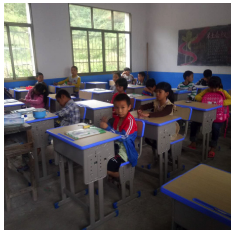
▲2018年9月为湖南省新邵县上南完全小学配备新桌椅和电脑