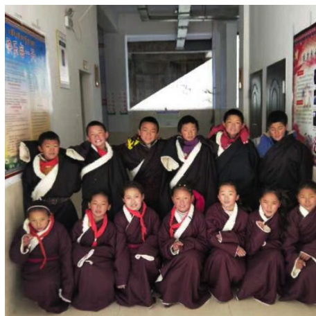
▲2018年12月为四川省甘孜州炉霍县洛秋乡中心小学的学生们加急赶制105件藏袍,并在学期的最后一天送到学校、分发给孩子们