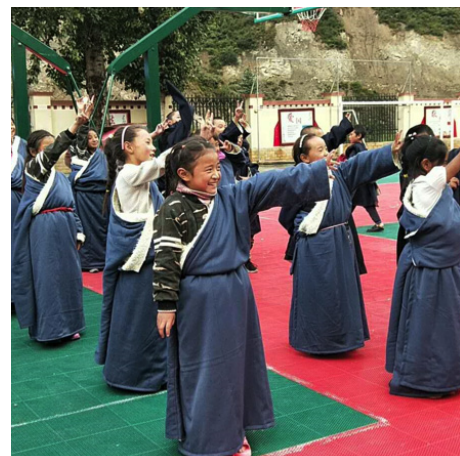
▲2018年9月在冬天到来之前为四川省甘孜州新龙县色威乡中心小学的学生们送去300件藏袍