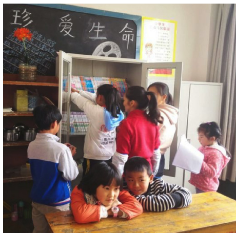
▲2018年3月在云南宜良县兴隆小学设立5个班级图书角