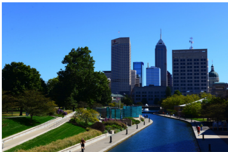
▲印第安纳波利斯市中心，天蓝水也蓝。

除了印城，人口超过10万的城市在印第安纳只有三个。第二大城市韦恩堡（Fort Wayne）的人口约为25万。韦恩堡有个很不错的儿童动物园，大人小孩都值得一游。韦恩堡还有个叫甜水（Sweetwater）的乐器店，是美国最大的乐器店，只要你能想得出来的西洋乐器，都能在那里买到。第三大城市埃文斯维尔（Evansville）的人口为12万。埃文斯维尔位于俄亥俄河边，是南印第安纳大学（University of Southern Indiana）和埃文斯维尔大学（University of Evansville）的所在地。第四大城市南本德（South Bend）人口刚过10万，近年来还呈下降趋势，是著名的圣母大学（University of Notre Dame）和印第安纳大学南本德分校（IU South Bend）的所在地。南本德靠近密歇根湖，受大湖效应的影响，冬季的总降雪量平均可达2米。对很多人来说，2米的降雪量已经很多了，但比起五大湖周围的一些城市，这个降雪量不算很大的。纽约上州的雪城（Syracuse）年平均降雪量高达3.2米，是美国名副其实的雪城。从南本德再往南，年降雪量就逐