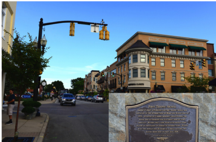
▲ 梅尔市中心（Main Street和Rangeline Road）。1923年，这个十字路口安装了美国历史上的第一个自动交通灯。在这十字路口的东北角立有一个地标（见照片中的嵌图），以纪念这一重大历史事件。

在惊叹印第安纳为美国的南北战争做出重大贡献和牺牲的同时，顺便感慨一下南方邦联这两位重量级人物的最后归宿。戴维斯总统（实际上是个伪总统）在输掉了内战之后，在监狱里被关了四年。出狱之后，他的日子过得相当滋润。他当过保险公司的主席，重新当选为美国参议员（尽管最后没有当成），还差一点当了德州农业和机械学院（现在的著名的德州农工大学）的校长。戴维斯总统在81岁高龄时病逝，得以善终。那位李将军呢，他在向联邦军投降之后，居然马上就做了华盛顿学院（Washington College）的校长，一直做到1870年去世为止。他刚去世，华盛顿学院就改名为华盛顿和李大学（Washington and Lee University），以纪念这位南方邦联的军事首领。当年南方邦联州之一的乔治亚（Georgia）亚特兰大市（Atlanta）的郊外有一块高达251米的神奇巨石，巨石的侧面刻有一副巨大的浅石雕，上面刻着骑在高头大马上的戴维斯总统、李将军和另一位著名南方邦联将军杰克逊（Stonewall Jackson）。在美国，分裂分子的雕像居然一直让人膜拜，这个度量不是所有的国家和政权都能有的。也