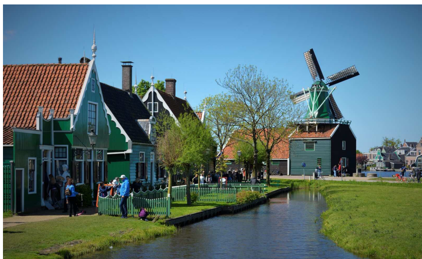
都说去荷兰一定要去看看风车，邻近阿姆斯特丹的著名风车村桑斯安斯 (Zaanse Schans Windmills) 是游客必到之地。

时代造英雄。十七世纪的鼎盛也造就了荷兰历史上最伟大的绘画大师 (The Old Masters): 比如伦勃朗 (Rembrandt Harmenszoon van Rijn 1606-1669) 是最近荷兰评比荷兰历史上最伟大画家的排名榜上第一 (梵高竟然被评为第二)，代表作之一：《尼古拉斯·杜尔博士的解剖学课》(1632) 海牙博物馆收藏；还有维梅尔 (Johannes Vermeer 1632-1675) 代表作之一：《戴珍珠耳环的少女》(约1665) 海牙博物馆；再就是一位上面提到的《巴别塔》的作者：老彼得·勃鲁盖尔。之所以称他们大师，是因为他们代表了西北欧文艺复兴，从局限于圣经的题材、绘画范畴扩展到景物、凡人肖像和田园生活，绘画技巧上也有创新的突破。