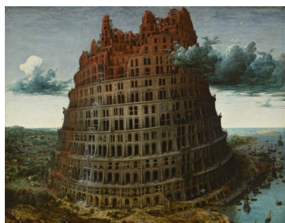
老彼得·勃鲁盖尔的名作《巴别塔》。