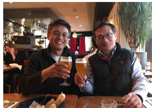
造访当年赴英留学、现在阿姆斯特丹工作的老同学。