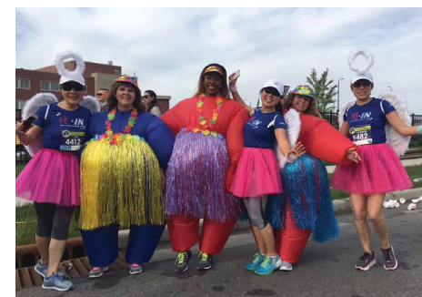
▲ 仙女相遇 ▼ 我是你的腿