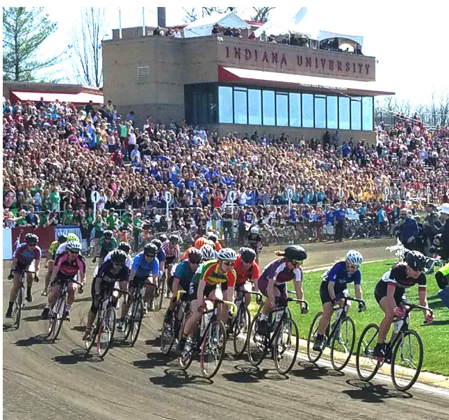
▲激烈的赛场、热闹的啦啦队

阿姆斯特朗体育场的比赛场地是单圈0.25英里的煤渣跑道，就像世界闻名的“印地500”赛车（Indy 500）一样，参赛选手们要在跑道上骑行200圈，只不过，距