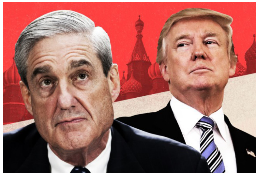
穆勒与川普

【本报综合】据NBC 4月12日消息，对川普总统妨碍司法（Obstruction of Justice）的特别调查最近有重大进展，调查委员会计划在5月至7月间向代理总检查长 Rod Rosenstein 提交报告。川普总统妨碍司法的主要事件如下：