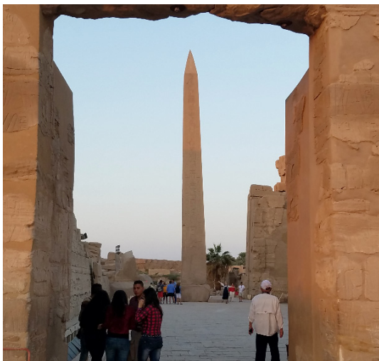
▲ 卡纳克神庙1 ▼ 卡纳克神庙2