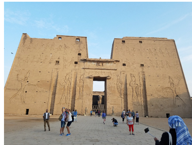
▲ 埃德芙神庙 ▼ 左：尼罗河上的小贩；右：卢克索的热气球