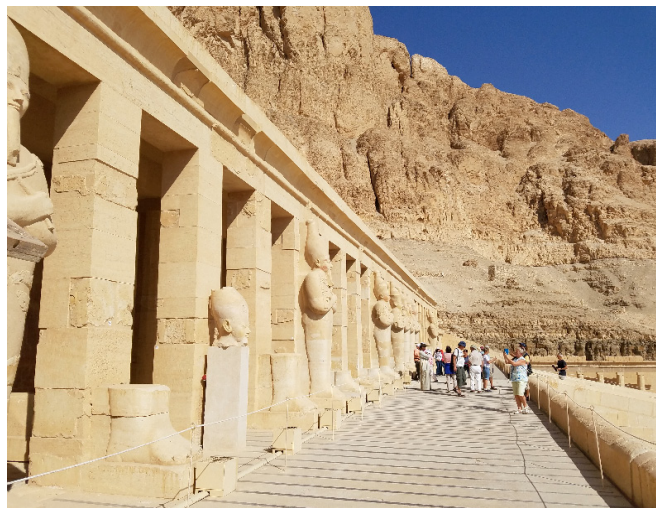
▲ 女神庙 ▼ 卢克索神庙