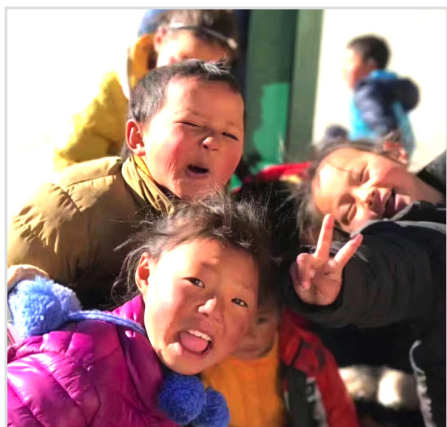
四川省甘孜州新龙县色威乡中心小学的学生们。