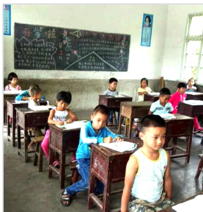
湖南省邵阳市新邵县大新镇上南完全小学的同学。