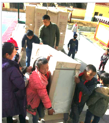
四川省甘孜州新龙县色威乡中心小学学生搬运新到的书柜和书。