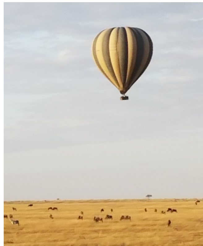
▲ 马赛马拉的热气球