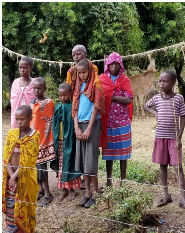
▲ 旅店周围的马赛儿童