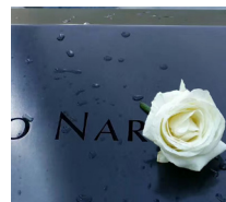
纪念池上的花， 那点点滴滴该是生者的泪吧！

鞠躬敬故人， 献花祭天堂。 忽觉秋来风已凉。 仰问天何季？ 月圆箫声长， 酒浓花亦香。 只恨月圆人无缘， 相聚恨无殇。