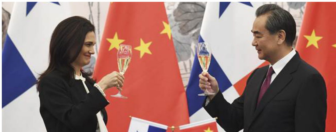
巴拿马副总统伊莎贝·圣马洛 (Isabel Saint Malo) 和中国外交部长王毅签署建交公报后举杯庆祝。

6月12日巴拿马总统瓦雷拉宣布巴拿马和中国正式建交，同时与台湾断绝外交关系。消息传来，如同当头一棒，震惊了事先毫不知情、完全蒙在鼓里的台湾朝野。近半年来，先后有三个国家与台湾断交，从而使承认台湾的国家减至20个。最近，世界卫生组织 (WHO) 大会并未邀请台湾代表参加，引起台湾民众强烈的不安和失望。这些都使台湾当局在国际社会中陷入了空前孤立的困境。