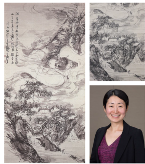
"The Tip of Her Brush Can Wipe Away One Thousand Armies": Okuhara Seiko (1837-1913) and the Gendering of Literati Art