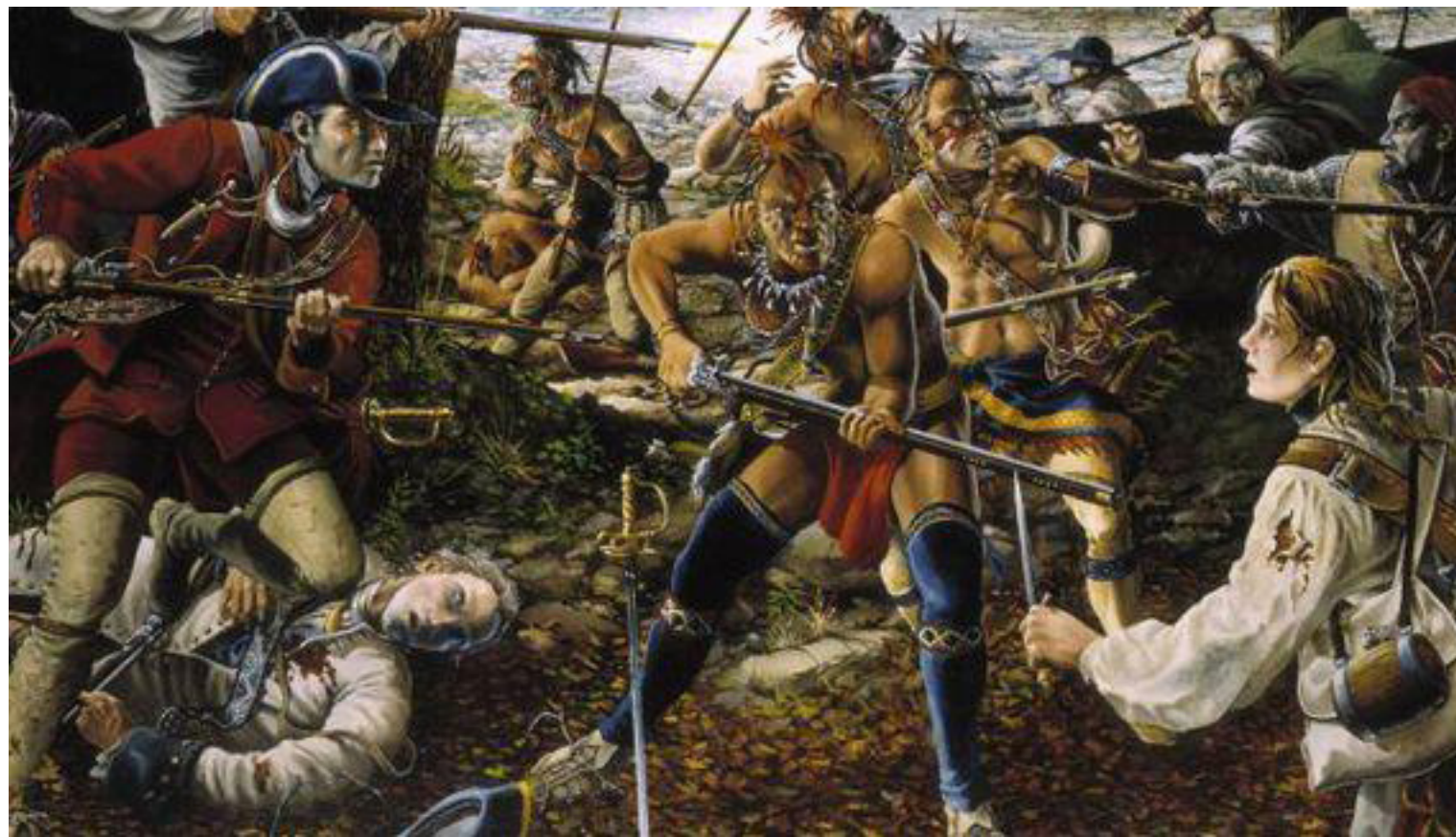
印第安人与美国白人的战争