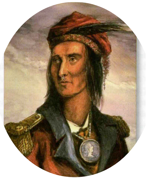
特库姆塞 (摘自百度百科)

特库姆塞 (Tecumseh)，北美历史上最著名的原住民英雄，印第安人肖尼族首领，以骁勇善战，追求在中西部地区建立印第安部落联盟著称。相传1768年他出生的时刻，一个神灵的凶猛猎豹，闪耀着流星的光芒，从黑暗的天空呼啸而降。周围人立刻感悟到，他们正在见证一个天命不凡之人的诞生。那是在俄亥俄州西部的一个印第安人村庄。四周毛桦古树参天，胡桃橡树林立，黄樟散发着甜香，随风送出。因为天生负有大神使命，他从小就必须超群出众，带着厚重的羽翼成长。特库姆塞成长得瘦挺而精干，有着远超当时印第安人平均高度的五尺十寸的身材，以及一双自命不凡、似能洞悉人心的淡褐色双眸。