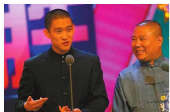
曾经情深意切的师徒

要是唐僧和猴子是合作，教主和众弟兄是合作，官府和民众是合作，这种关系就有弹性。爹和儿子的关系，里面是搁不下利益的。但合作的关系就比较活，可以搁下下利益，允许讨价还价。