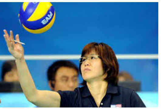
郎平在赛场上的英姿。