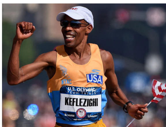
41岁的Meb Keflezighi在美国奥运马拉松选拔赛中冲向终点。