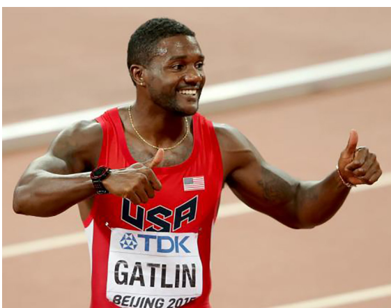
Gatlin在2015年北京世界田径锦标赛中以0.01秒之差屈居男子百米第二。