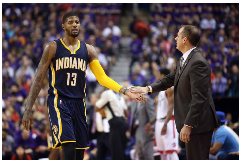
乔治表达对恩师沃格尔的感谢。

要想多得分，伯德首当其冲还得倚靠乔治，在和猛龙的七场大战中，他场均砍下27.3分、贡献7.6个篮板和3.1次助攻。26岁的他和步行者还有三年合同在身，正处于生涯最佳的阶段。未来的五到六年如果没有大的伤病，他都会是NBA最好的球员之一，更是伯德和步行者建队的基石。而控卫位置上的乏善可陈是步行者最大的软肋，希尔和埃利斯都非联盟顶级控卫。结束和多伦多猛龙的季后赛后，伯德面临选帅、选秀和自由市场交易等诸多重建问题。