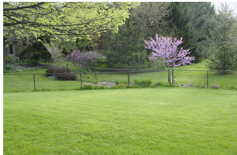
这是我家后院一角。左边邻居比我勤劳，草坪也比我家的。篱笆外面一家的草坪就比我家的差远了。

总之，房前屋后的小草坪是要花时间和银子去维护和保养的。虽然没有必要把自家的草坪整理得像高尔夫球场的草地，但也不能疏于管理，让草坪长满杂草。