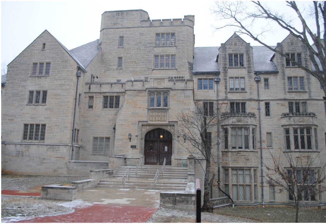
坐落于IU布鲁明顿的金赛研究所

编者按： 金赛是性学历史上最伟大的性学家，金赛是从IU走向世界的，故而金赛是IU的骄傲，是IU一笔最贵重的无形资产。金赛是丰富的，他不仅写了金赛报告，创立了同性恋尺度理论，而且还有很多很多为人知的层面和角度。本报从这期开始，连载黄文泉和周炼红合著的《金赛是谁？》的有关章节，以揭示多彩的金赛。本文摘自该书第十一章