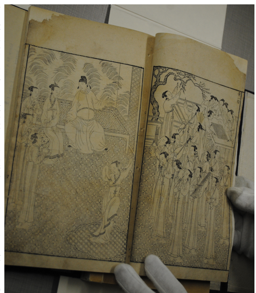
珍藏在金赛研究所的出版于明朝万历年间的《素娥篇》

金赛除了对东方多彩别致的性文化充满了好奇和欣赏外，他还对中国的饮食文化也推崇备至。一个纽约的企业家，也是金赛的朋友，有一个中国厨师，当金赛到旧金山的时候，这个中国厨师在那里的那个城里安排了一个晚宴，金赛为之赞叹不已。因了金赛对中国菜的欣赏，电影《金赛》才在结尾的地方安排了一个中餐馆的场面。不幸的是，在电影中，金赛正是日暮途穷的时候，洛克菲勒基金会断绝了财经支持，政府正对他展开调查，社会上乱糟糟的叫骂。像孔子一样周游列国推销自己的学说，企图获得君主们的理解和支持，金赛四处推销自己宏伟的研究计划，企图征求财政支援。孔子是三月不知肉味，金赛则是周遭不见铜板。在那个中餐馆，他跟一个富人聚会，