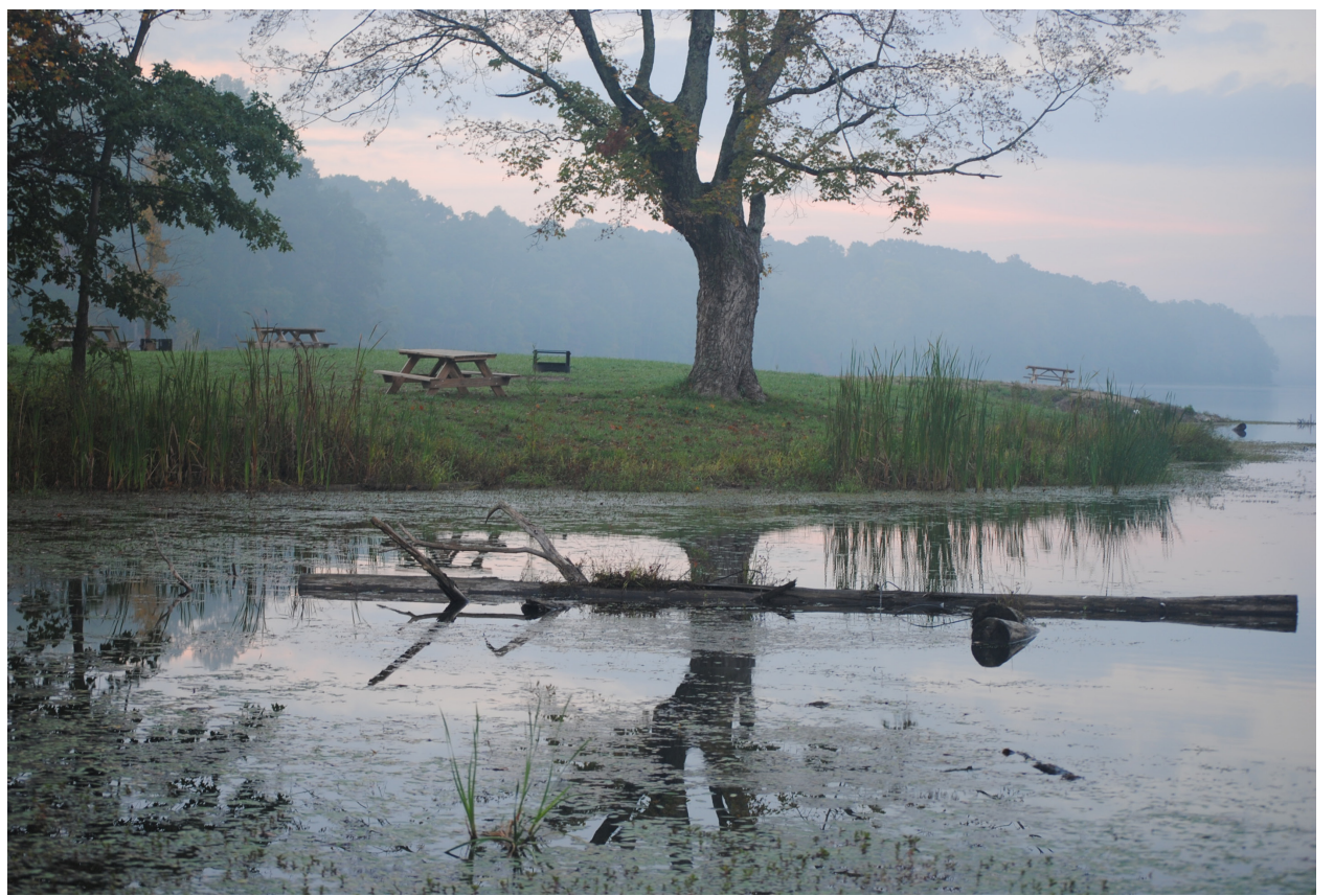
▲摄影地点：Yellow Woods ▼摄影地点：Brown County State Park

那变换的脚步 让我们难牵手 这一生一世 有多少你我 被吞没在月光如水的夜里 多想某一天 往日又重现 我们流连忘返 在贝加尔湖畔 多少年以后 往事随云走 那纷飞的冰雪容不下那温柔 这一生一世 这时间太少 不够证明融化冰雪的深情 就在某一天 你忽然出现 你清澈又神秘 在贝加尔湖畔 你清澈又神秘 像贝加尔湖畔