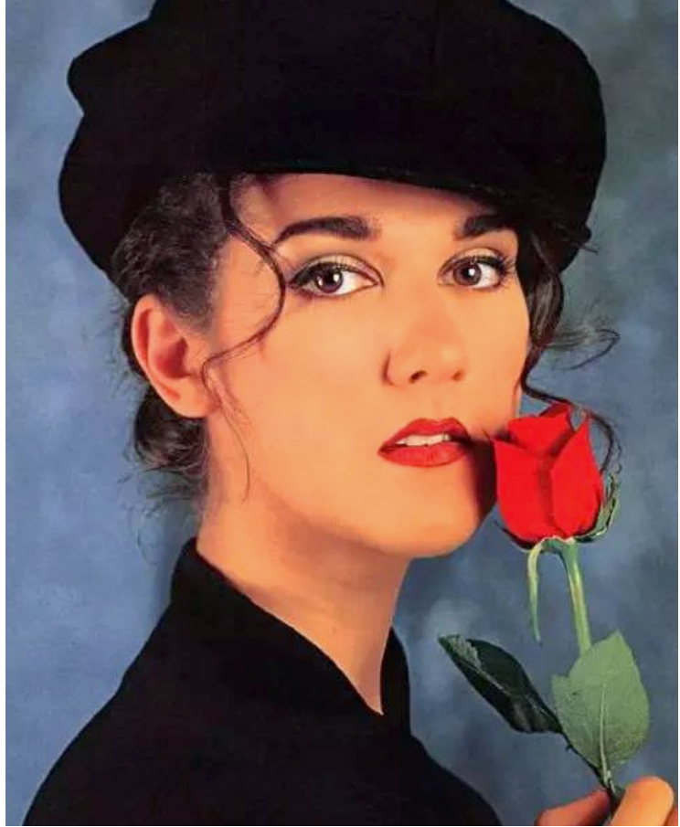
歌后席琳·迪翁