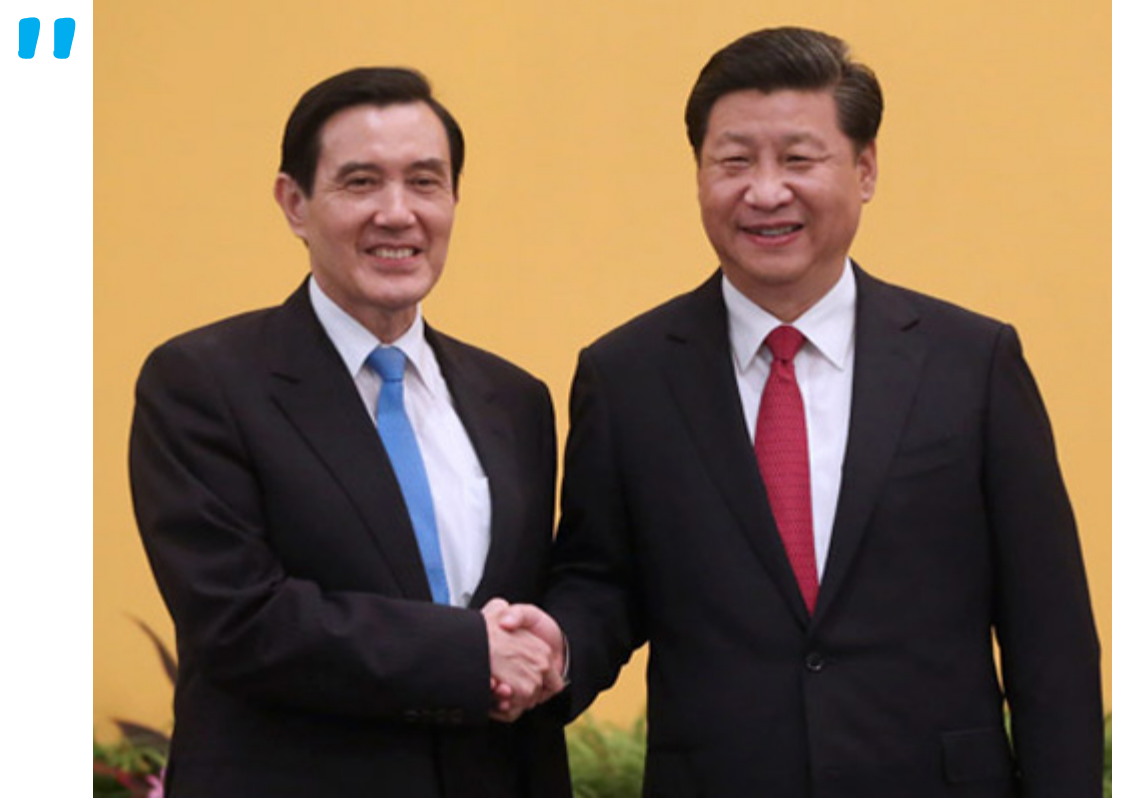
2015年11月7日，两岸领导人历史性握手。

首先，在台湾问题上的建树有助于在党内立威，巩固其正在经营的集权统治。习近平上台后，在王岐山的辅佐下，以反腐为旗