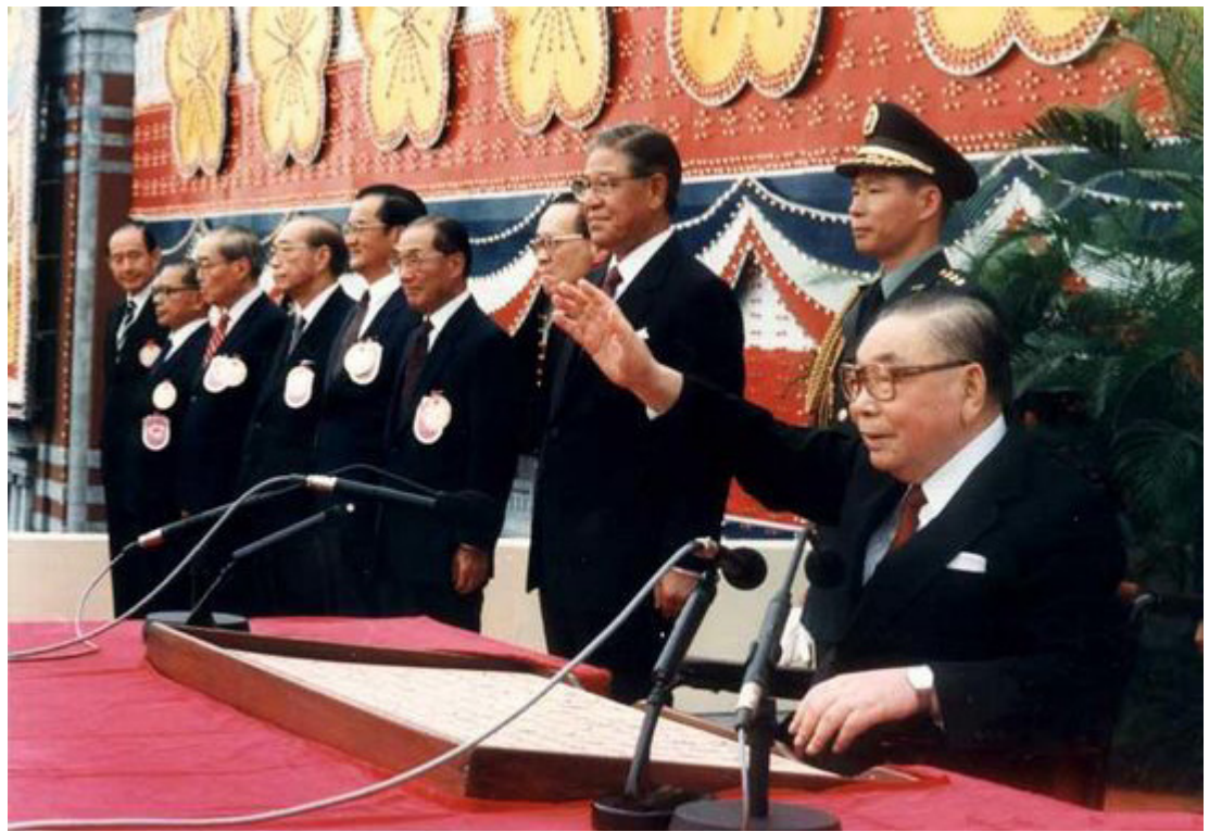
1987年7月14日，台湾“中华民国总统”蒋经国发布命令，宣告台湾地区，包括台湾本岛和澎湖地区，自明日零时起解除戒严。历时38年的两岸隔绝，终于重新互通往来。图为1987年，蒋经国（右一）最后一次主持“双十节”盛会，右三为李登辉。