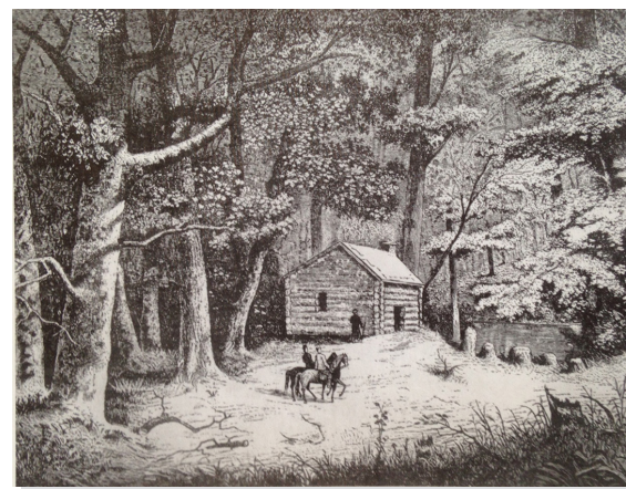
Indianapolis 1820: 路上的树根，到处是树，后面是白河。(摘自《Indianapolis, A Circle City History》)

市政改革：现在大家已经无法想像，1970年以前印城的政府是如何工作的。当时，在同一片土地上，竟有印城市政府和Marion县政府两套机构。就拿市政府来说，市长及9位常委