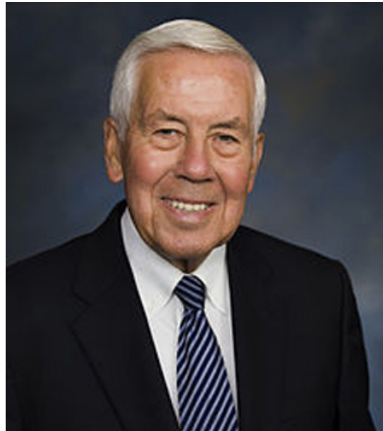
首任市长Richard Lugar (1968-1976)

在1861至1865年的美国南北战争中，20万印州人走上战场，支持废除奴隶制度，2万5千人为此献出了生命。此间，印城不仅作为印州的决策中心，也因其中心的地理位置，起到了关键作用。以印城为枢纽的铁路网，从200英里增加到2000英里，运送军队、运输给养。战后，铁路也将印城带进了其发展的黄金时代（1880年至一战前）。运输的便利给制造业提供了发展的机会，也使印城成为物流中心。Kingan and Company, L.S. Ayres, 礼来制药公司等相继成立，汽车制造业初建，印城开