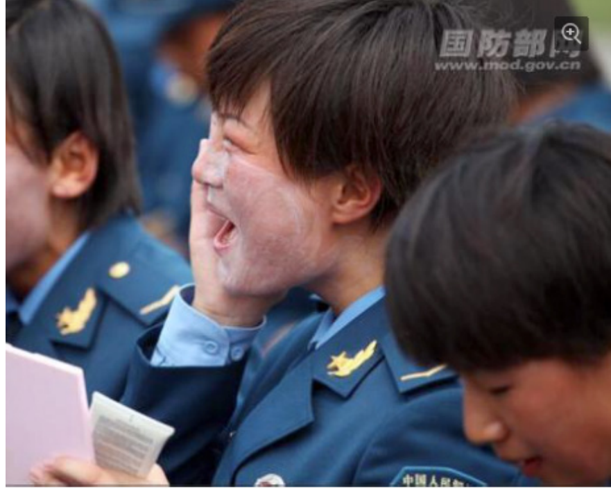
8月19日，中国女兵亮相阅兵场。图为排练间隙，女兵们正对着镜子涂防晒霜。

三，9月赴京参加纪念活动。日媒此前报道称，安倍表示愿意访问中国，但考虑到参加阅兵式可能引起日本国内政治力量的反对，倾向于避开阅兵，在70周年纪念活动之前或者之后赴华访问。