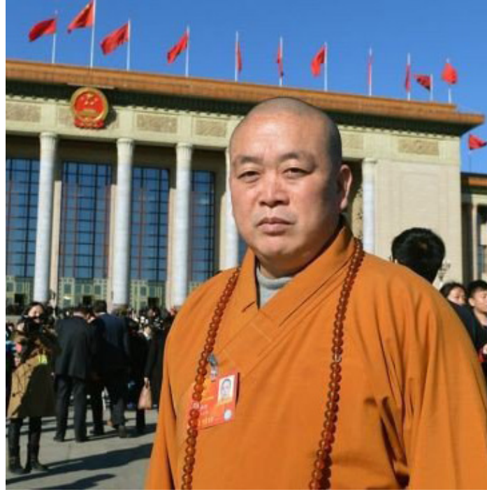
用网络恶意诋毁、诽谤方丈释永信”。而8月5日河南省登封市人民政府网站消息称，登封市宗教局4日夜间发布消息称，经核查，没有释正义这个人，其他事项正在核实之中。(综合自中国日报网、腾讯新闻，资料图)

7月30日上午，30名少林寺弟子通过网络发表声明。该声明称，本月7月25日署名“释正义”者，通过网络举报师父一事“属恶意诋毁、诽谤”。此外，声明还表示已经查明自称“释正义”者实为释延鲁，祖籍山东。举报的动机为：“对于当初被迁单还俗一事，怀恨在心，才引发此次利用网络恶意诋毁、诽谤方丈释永信”。