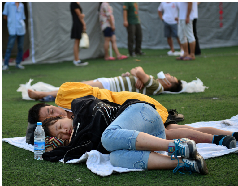
8月13日清晨，在天津开发区第二小学的临时安置点，一对情侣在操场上入眠。