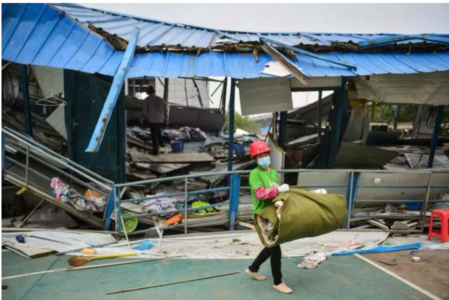
8月18日，在与爆炸点直线距离约500米，隶属福建五建的建筑工地，工人们陆续从倒塌的板房宿舍里搜寻部分财物。据在场工人介绍，这片两层高的宿舍，住着二三十名建筑工。爆炸时，由于一层没有住人，且板房倒塌速度较慢，他们才得以逃生，有人受伤，但不算严重。