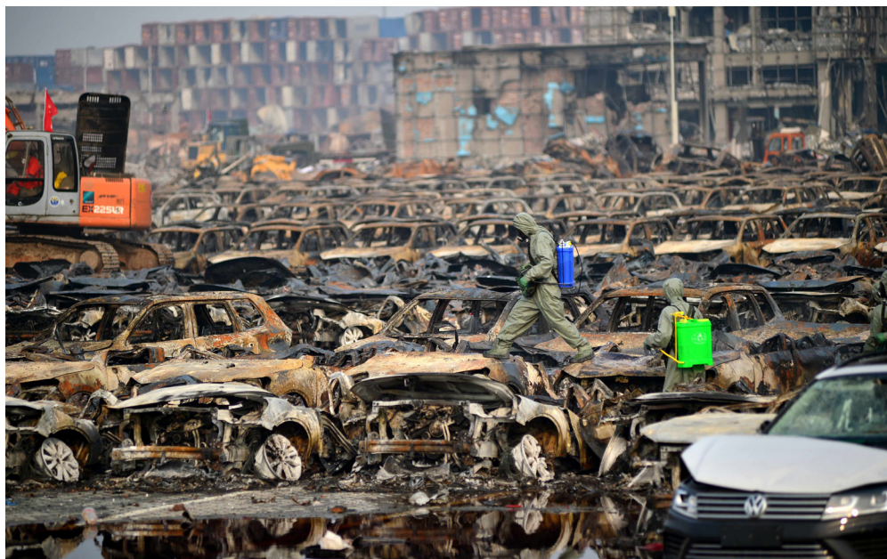
8月20日，爆炸核心区，救援人员踩在一辆被烧成废铁的汽车上喷洒双氧水，用于中和洒落的有毒物。