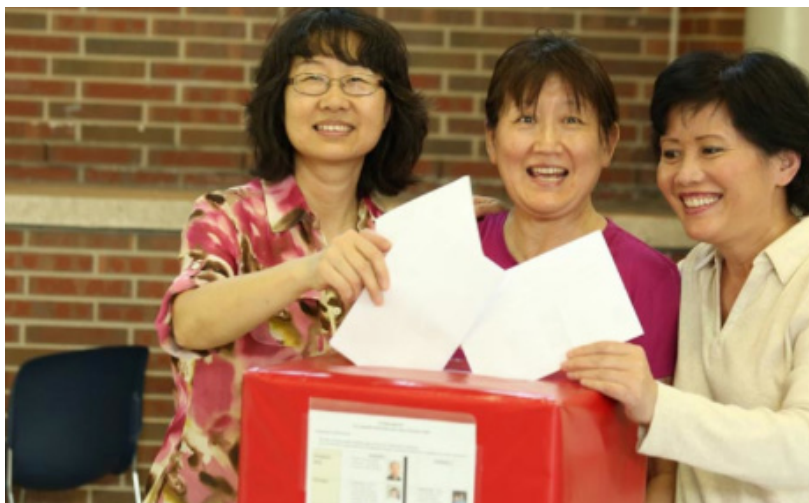
投上神圣的选票（上） 认真对待每一张选票（下）

ICCCI的志愿者们，很多是来自中国大陆的第一代移民，他们在一党专政的环境下长大，对“民主”的概念和“选举”的意义如何理解，如何付诸实践？这不但是华人社区的一次演练，也是美国主流社会的观点。