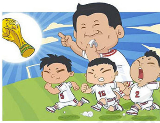
漫画摘自新浪体育

“中国民间隐藏着7000个梅西”，这是日本《产经新闻》援引英国的调查结果得出的结论。中国人口基数大，“人多力量大”，这是中国的人才优势。但“人多嘴杂”，容易一盘散沙，这也是中国的劣势。现在，中国国家主席习近平亲自主导足球改革方案，意在实现中国足球崛起。而中国富豪也在加速进军欧洲足球界，势头不容小觑。德国的《世界报》甚至大胆预测，在足球改革的支持下，2030年的世界杯很可能是中国夺得冠军的机会。