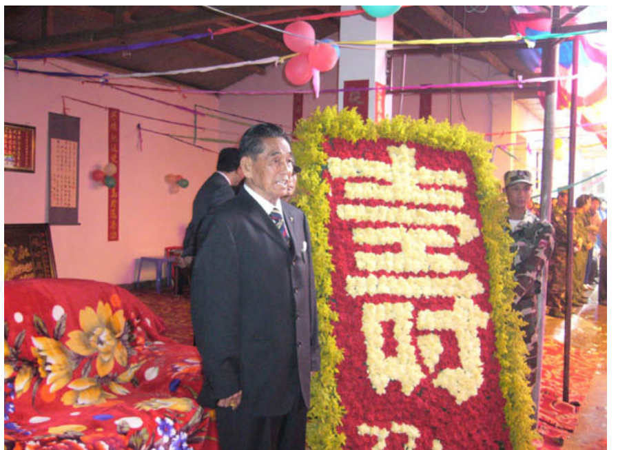
彭家声在庆贺自己77岁生日的宴会上