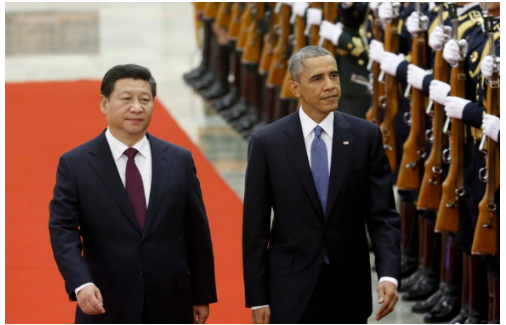
11月12日，习近平在北京人民大会堂举行欢迎仪式，欢迎美国总统奥巴马对中国进行国事访问。

形式上，ITA隶属于WTO框架。ITA成员必须向所有WTO成员提供同样的关税协议。由于汇聚了美国、日本、中国和韩国等高科技强国，此次APEC北京峰会被谈判者视为完成ITA扩展谈判的绝佳地点，而该谈判之前已拖延了一年多的时间。